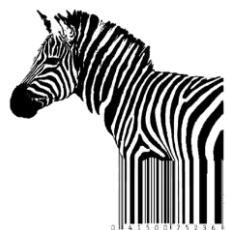
シマウマの縞が バーコード