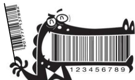
ワニの歯もブラシも バーコード