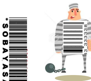
牢獄の檻がバーコード 囚人服にもバーコード