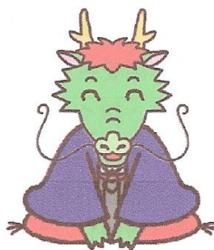
うみ(卵・巳)の中にある