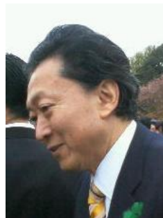
宇宙人 御苑の花見 雨中にて