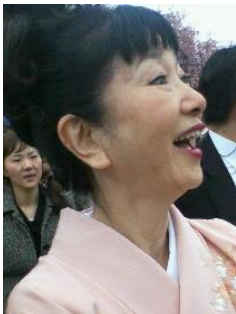
「みゆきさん」 呼べば応える ノリのよさ

それはともかく、時の総理夫妻の生写真を伝笑鳩に掲載できるとは、思ってなかったなあ。ホント。