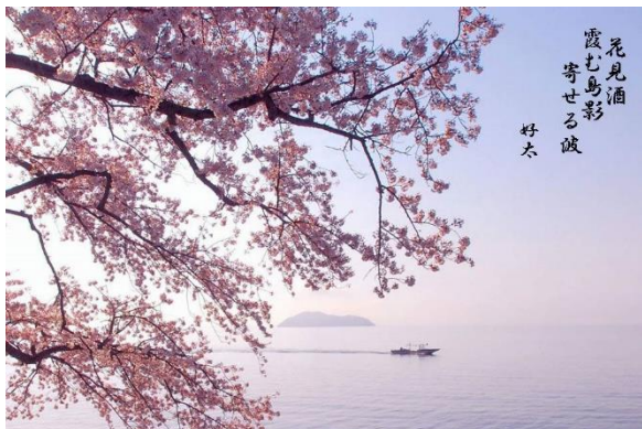
花見酒 霞む島影 寄せる波 好太