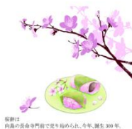
桜餅は 旧暦の長命寺門前で売り始められ、今年、誕生300年。