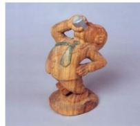
上を向いてアルコール (涙も酒もこぼさんぞ!)