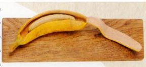
損なバナナ (バナナのみイラだぞ!)