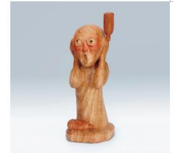
ムンク「さびたれ」 (酒にモンクは言うまいぞ!)