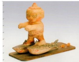
あんよはジョース (どや 上手やろ!)