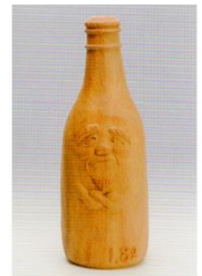
一生瓶 (酒浸りだわい!)