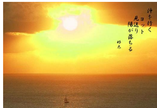
沖を行くヨット見送り陽が落ちる ⇒

人の世は笑劇川柳ネタの山 残る日々味わい深く万華鏡 邪心無し言ってる本人能天気 鉄砲百合森に分け入り恐れさす サンタさん激安店で値切ってる トランプのババ抜きゲーム大勝利