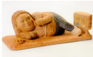
マツコ リラックス (今日は仕事無しだぞ)