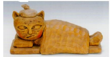
吾輩は猫んでる (漱石先生、薬速く！)