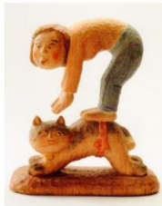
タマの腰に乗る (玉乗りは楽しいな！)