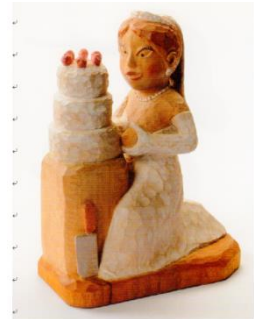
ケーキ乳頭 (新婦初仕事?)