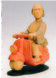
リョウマの休日 (イタリア旅行中)