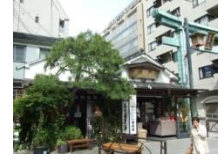
▲神田明神前の天野屋