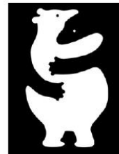
白熊？黒熊？ くまった、くまった