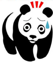
東京のあまりの暑さに 目を白黒させている 白黒パンダ

黒色と白色は「黒白の差」といって、二つの物事が非常に隔たってはっきりしていることをいう。「黒白をつける」物事のよいことわるいこと、是非、正邪をきっちりとさせる。ところが、世の中「黒白を弁ぜず」といって、区別ができないものが多い。今年の夏もはじめは猛暑。後半は一転して涼しく雨続き。異常気象に目を白黒させられた。