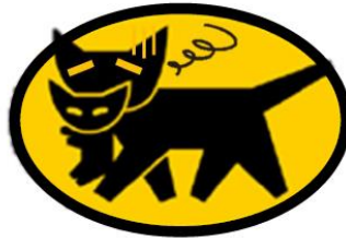
クロネコヤマトの宅急便も 猛暑にあちこち、目を白黒 苦勞猫の滅入る便