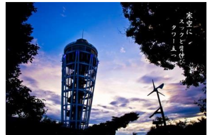
寒空にスックと背伸びタワー立つ

残り物競って食べるバイキング 「メガネ何処？」やと見つけた眉の上 買い物を全部済ませて孫忘れ