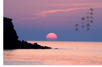
〇初日の出一礼二拍手願ひ千

くゝ当たる初夢二枚の切手だけ 半世紀添えば「あれ、ほら」で解かり合え 忘れたととぼける老いの処世術 電車乗るまるでスマホの展示場 シニアの期待の星は介護ロボ 酔い笑い初夢極楽直行便 人間に「ハンセイ」教えるインド猿