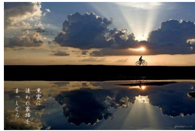
黒雲に追われ家路をまっしぐら