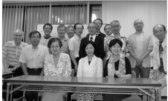
*女性3人とにんまり顔の男子組です。いいね！